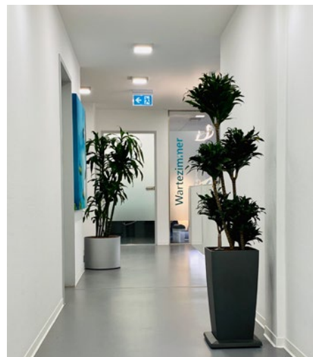
Strand oder Zahnarzt? Die Fußmatte lässt Zweifel aufkommen.... Der Flur gibt dann jedoch wieder Sicherheit: Hier ist man richtig!

mit der Zahnärztin um, und so musste sie zu keinem Zeitpunkt eine Neuakquise betreiben. „Für die Patienten blieb im Grunde fast alles gleich – die neue Praxis befindet sich ja nur rund einen Kilometer von der anderen entfernt. Die Resonanz auf die neuen Räumlichkeiten und den Inhaberwechsel war überaus positiv.“